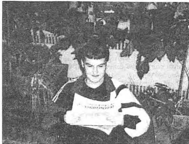
Чытаючы ўлюбёную газету

Ён добра ведаў, на што ідзе. Такія прадметы, як агульная фізіка, вышэйшая матэматыка, па якіх ён сёння вымушаны здаваць эк-