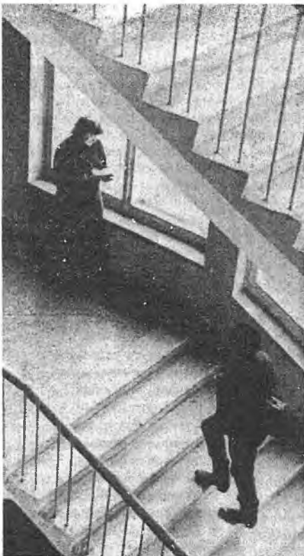
У лабірынтах ведаў

3.11. Ільготамі пры залічэнні пераможцы і прызёры алімпіяд «Абітурыент БДУ-2001» карыстаюцца толькі ў год іх правядзення.